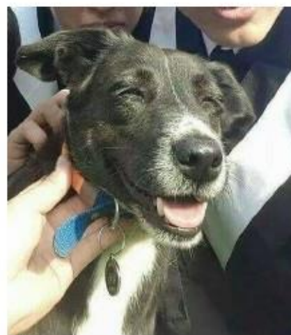
↑ 黑 girl

活動範圍遍及光復、成功、勝利校區等幾乎可以說所有校區都能看到牠的蹤影，黑 girl 親人喜歡往人多的地方跑，不時可見牠在人群中穿梭，同時對於人類非常信任，接受任何人的碰觸，同學有時暱稱牠為小白襪、踏雪，較無驅趕犬隻的能力，遇見其他犬隻會主動示弱、屈服，所以時常被咬傷。是校園內的人氣犬隻。