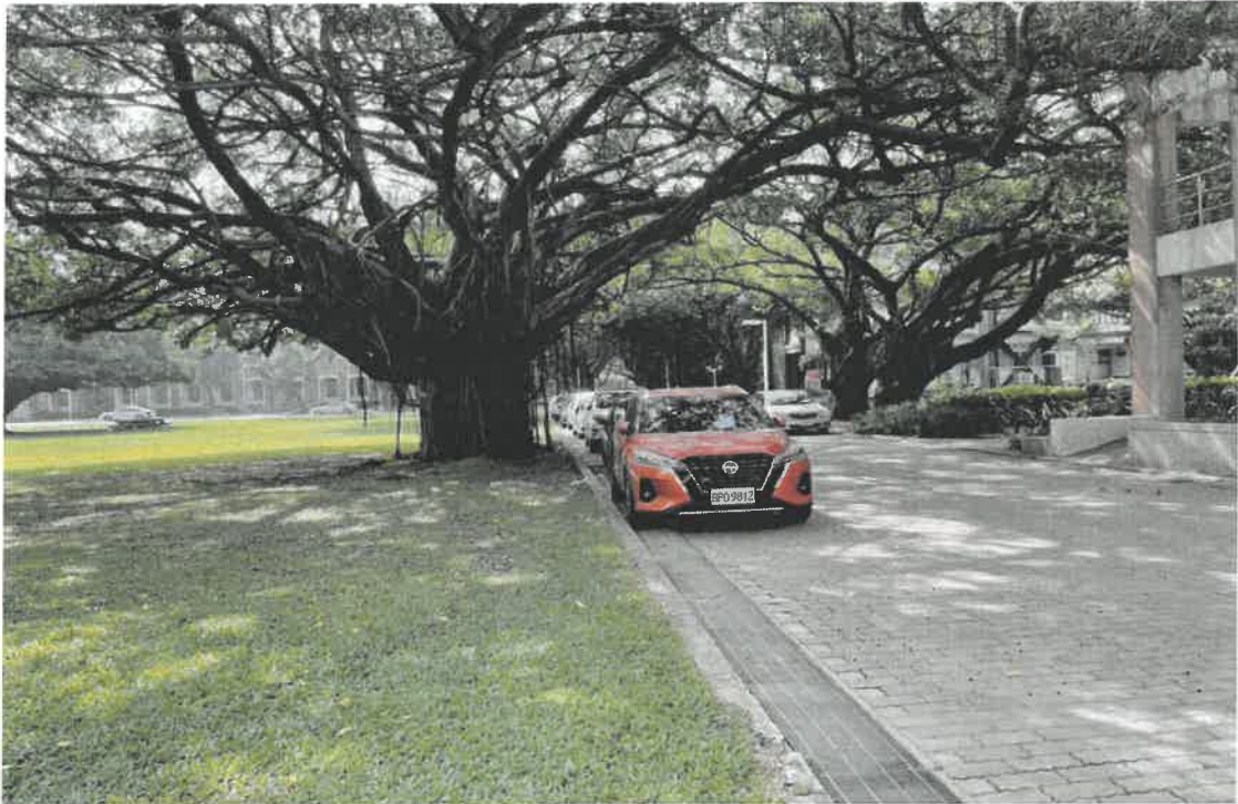
光復校區榕園西側臨建築系館、空中大學通道車輛違規(一)