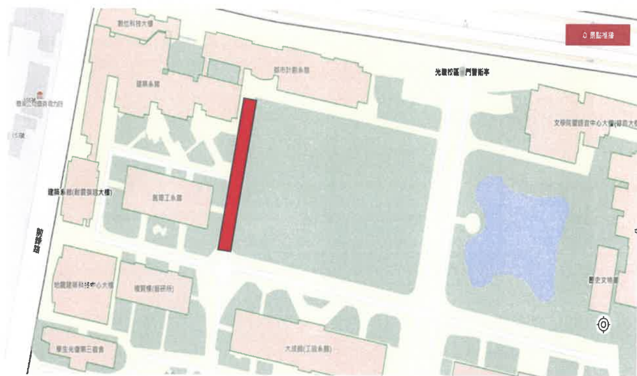
光復校區榕園西側臨建築系館、空中大學通道示意圖