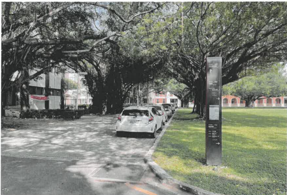
光復校區榕園西側臨建築系館、空中大學通道車輛違規(二)

決議：因停車需求考量，同意於通道東側劃設汽車停車格位，通道西側設置禁止停車標誌，由事務組安排劃設及設置。