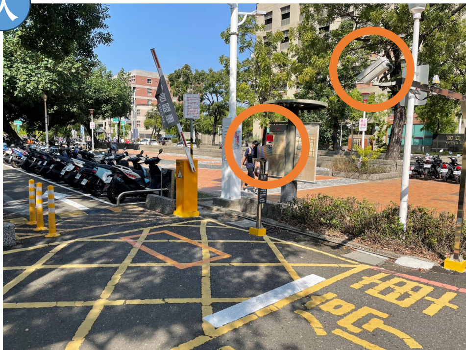
■ 停車場車牌辨識攝影機、卡機、剩餘車位數顯示器