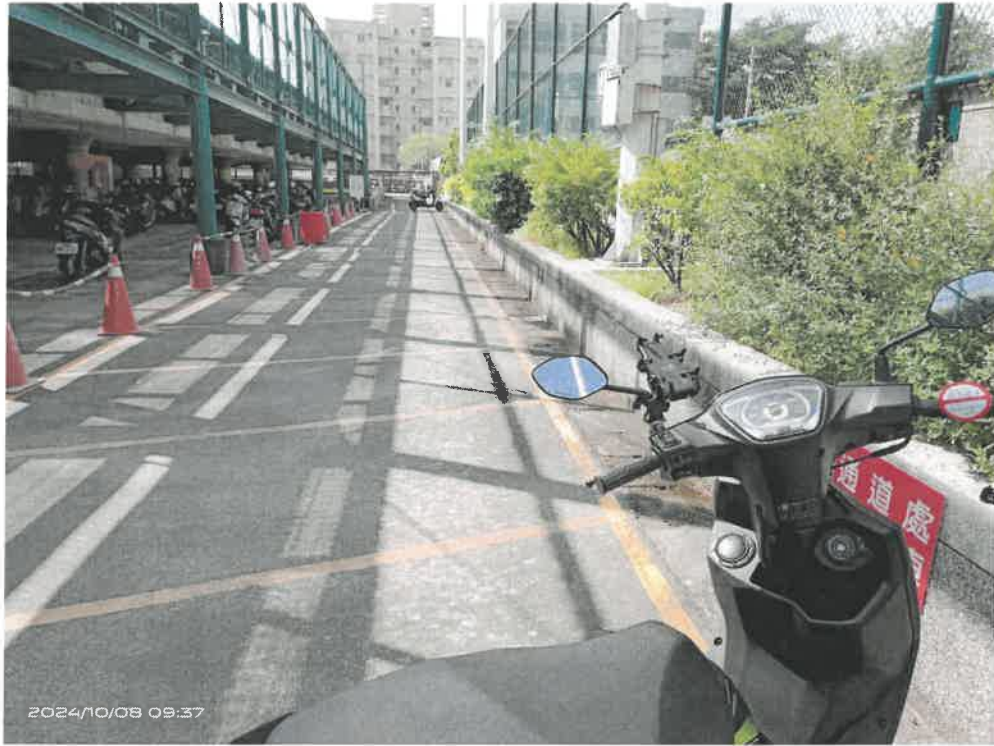
光復校區地下停車場西側通道現況