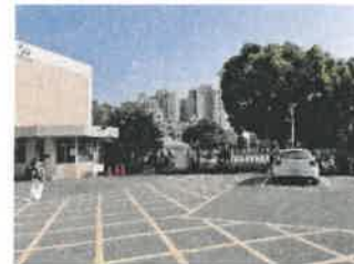
勝利校區劃設行人優先區起始位置示意圖

決議：照案通過。以勝利校區先行試辦，視實施成效，再考量推行至其他校區適合地點可行性。